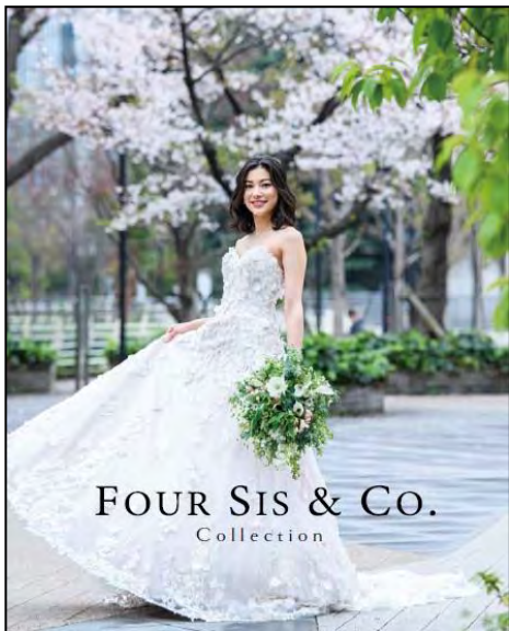
FOUR SIS & Co. (A4変形/12P)