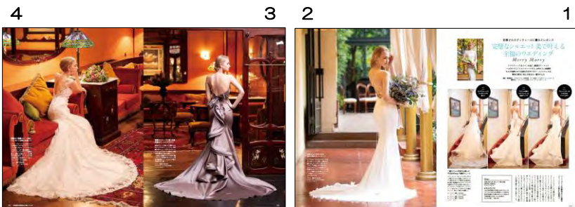
「Wedding BOOK 66号」メリー・マリー 特別タイアップ4P