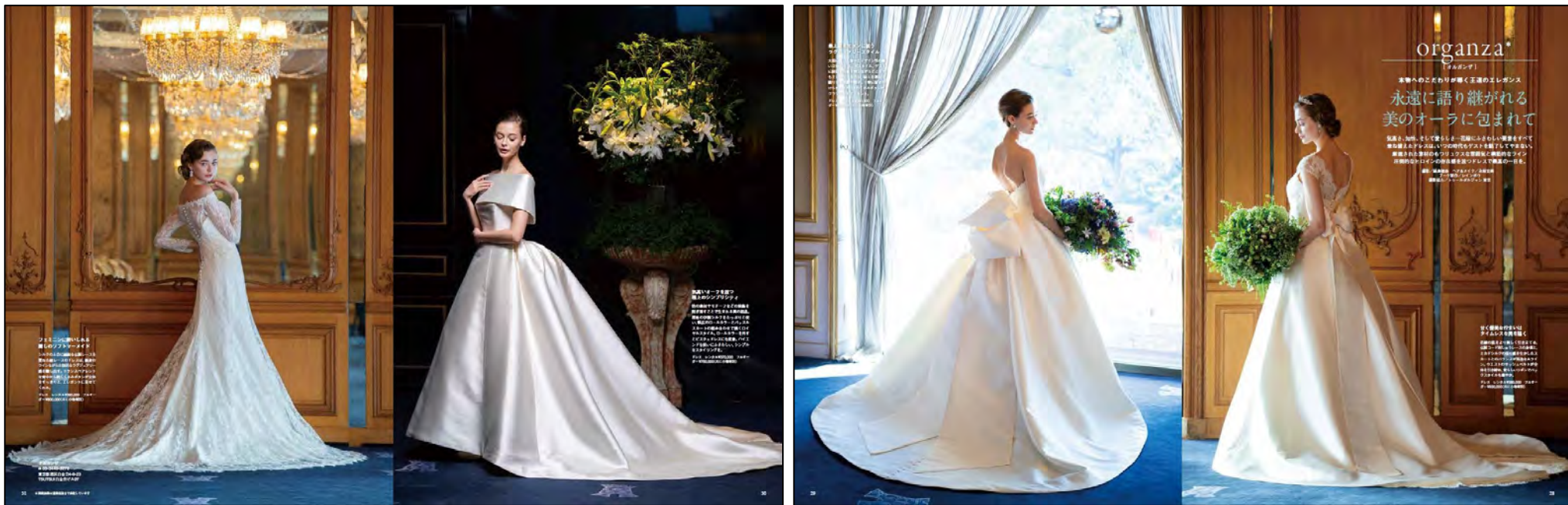
「Wedding BOOK 66号」オルガンザ フォーマットタイアップ4P

フォーマットタイアップ料金 2P ¥600,000 / 4P ¥1,000,000 ※消費税別途