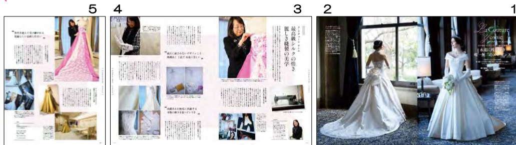
「Wedding BOOK 66号」ラ・クチュールヨシエ 特別タイアップ5P