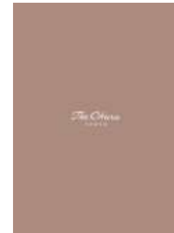
The Okura Tokyo (A4/24P)