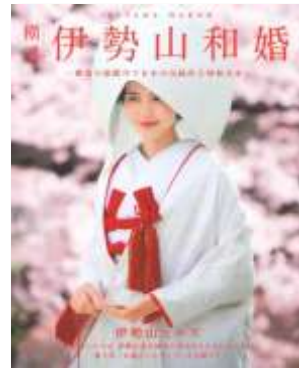
伊勢山ヒルズ (A4変形/12P)