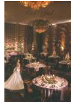
ホテルニューオータキ (B5/24P)