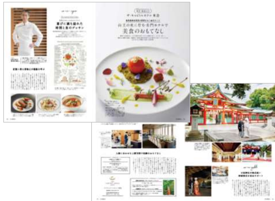
「日本の結婚式31号」 ザ・キャピトルホテル 東急様 特別タイアップ