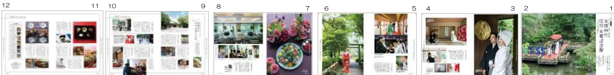
「日本の結婚式30号」 東郷神社・原宿 東郷記念館様 巻頭ビジュアル

※巻頭8ページ（神社様の場合+4P）は撮影いたします（衣裳、装花等は貴社にてご用意ください）