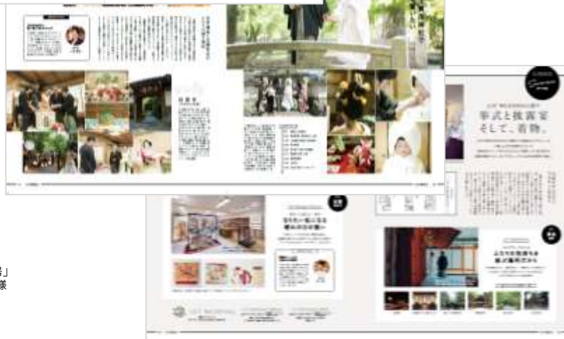
「日本の結婚式30号」 LST WEDDING様 特別タイアップ