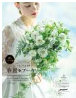
<過去掲載イメージ>