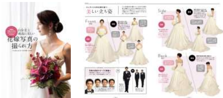
<過去掲載イメージ>

「お気に入りのドレス姿を一生の宝物にしたい…」と願うすべての花嫁のために、素敵な写真を撮るためのコツをレクチャー。カメラマンやヘアメイクアーティスト、場所の選び方から、撮られ方、アルバムの残し方などを紹介。