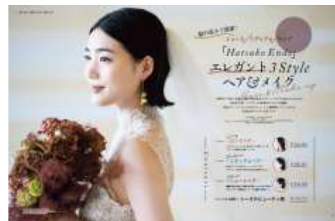
<過去掲載イメージ>