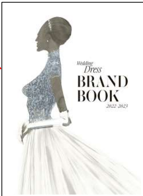
A5サイズの冊子を制作