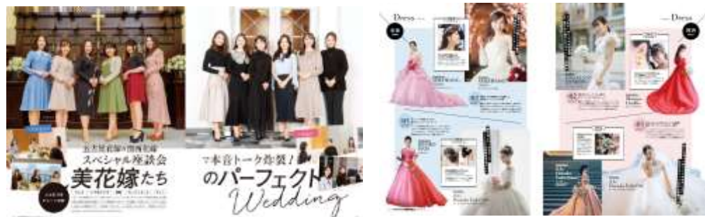
<過去掲載イメージ>

プレ花嫁を集めて『ドレス座談会』を開催します。憧れのブランドドレスやパーソナルなお悩みを解消する効果的な花嫁美容などについて、熱いトークを繰り広げます。