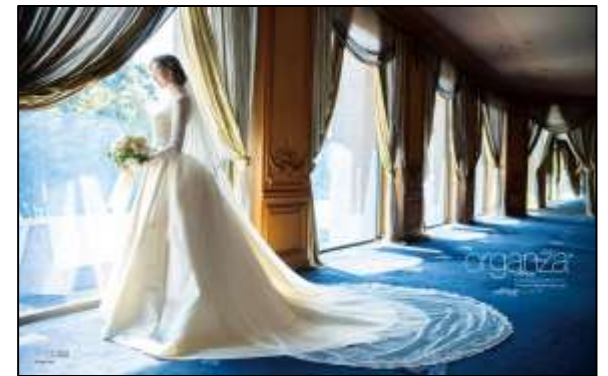
表2見開き 2ページ 100万円

読者が必ず目を通す表2見開きや、ブランディング効果が見込める表4など、貴社の世界観を訴求するに最適な広告といえます。掲載面は6種類ご用意しております。