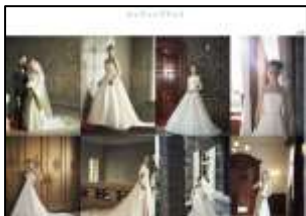
ウエディングドレス