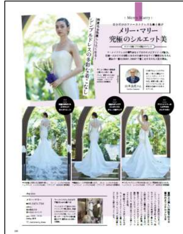
「Wedding BOOK 69号」 メリー・マリー フォーマットタイアップ4P