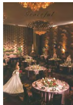
ホテルニューオータニ (B5/24P)