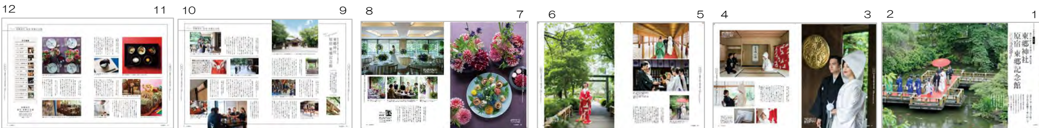
「日本の結婚式30号」 東郷神社・原宿 東郷記念館様 巻頭ビジュアル

※巻頭8ページ（神社様の場合+4P）は撮影いたします（衣裳、装花等は貴社にてご用意ください）