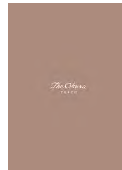
The Okura Tokyo (A4/24P)