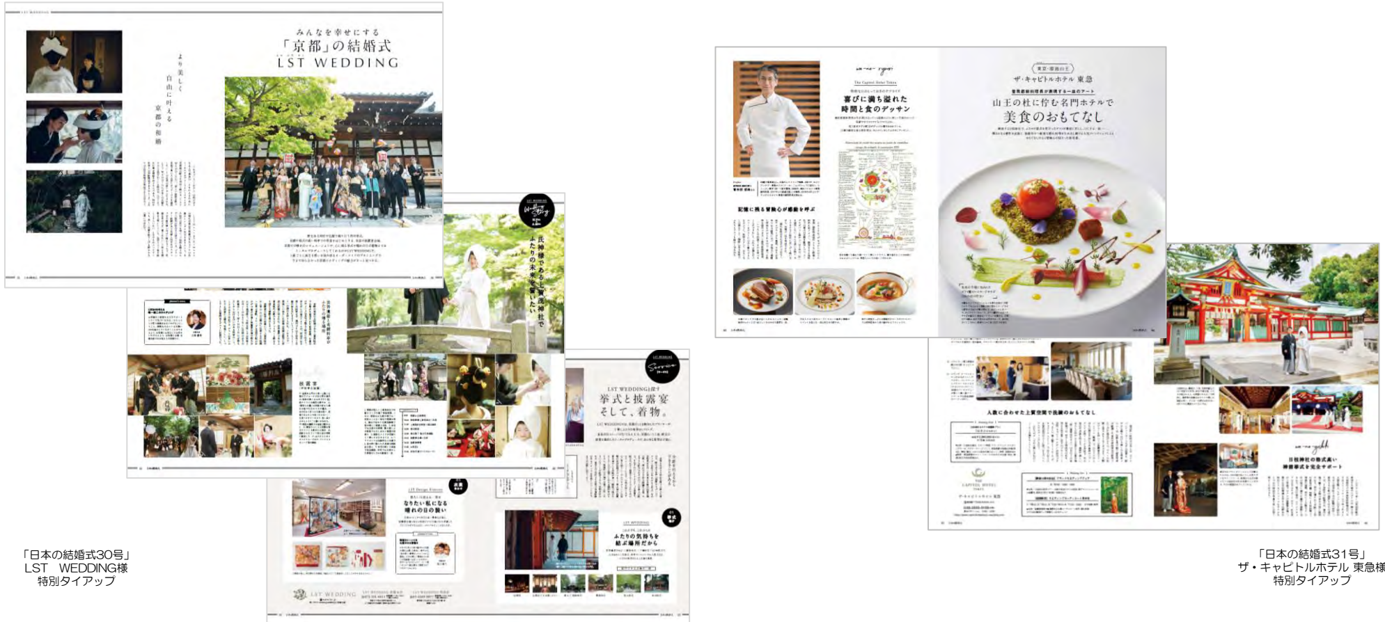
「日本の結婚式30号」 LST WEDDING様 特別タイアップ

フリーフォーマットで、伝えたい貴社の魅力・内容をわかりやすく特集記事風にて掲載します。