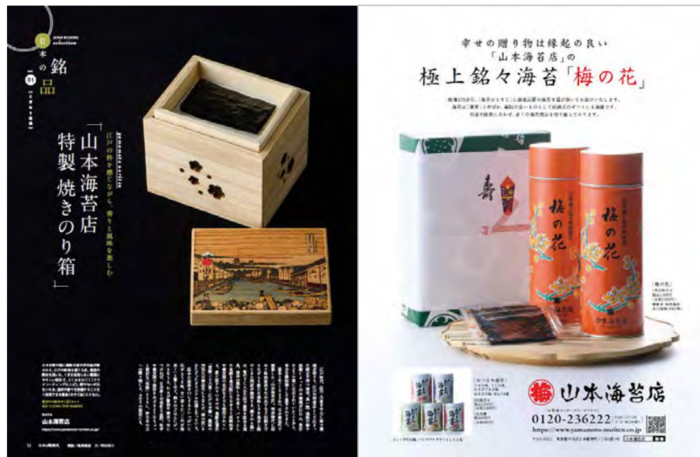
撮影した商品の紹介記事