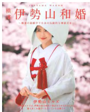
伊勢山ヒルズ (A4変形/12P)